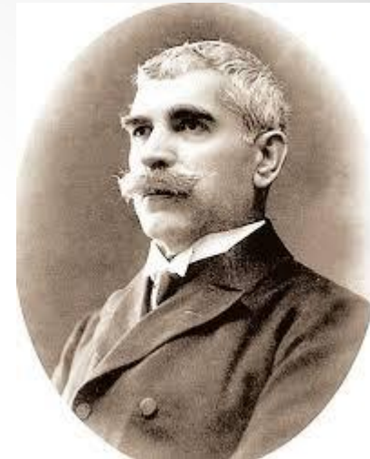
Иван Вазов (1850-1921)

на твоята жалост и тъга, на твоите сълзи и въздишки, на твоите страсти и тегло и на венеца мъченишки, кой грей на твоето чело.